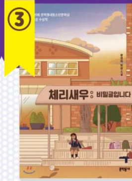
청소년 도서 체리새우: 비밀글입니다 황영미 / 문학동네