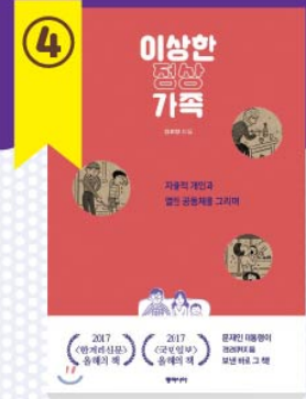
일반 도서 이상한 정상가족 김희경 / 동아사이