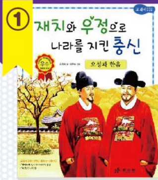
어린이 도서 재치와 우정으로 나라를 지킨 충신 오성과 한음 김희숙 글, 심춘숙 그림 / 효러원