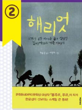
어린이 도서 해리엇 한운섭 글, 서영아 그림 / 문학동네