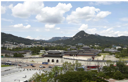
박물관 8층 옥상정원에서 바라본 광화문

대한민국역사박물관은 개항기부터 오늘날에 이르기까지 고난과 역경을 딛고 발전한 대한민국의 역사를 기록하여 후세에 전승하고, 국민들의 자긍심과 염원을 모아 미래의 희망을 이야기하는 역사문화공간입니다.