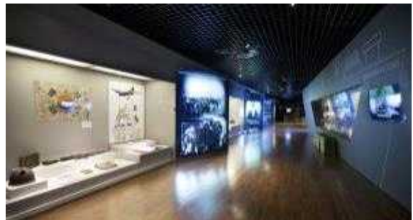
△ 상설전시실2 대한민국의 기초 확립