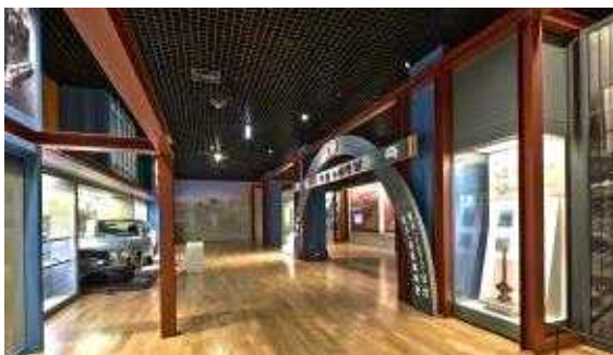
△ 상설전시실3 대한민국의 성장과 발전