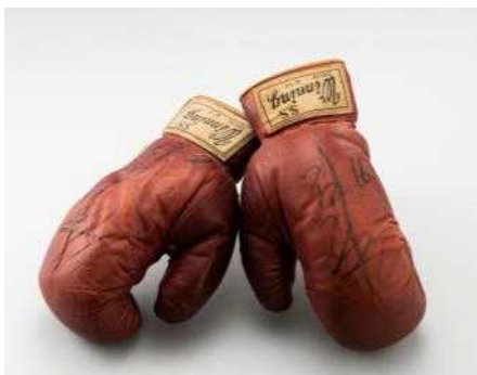
김기수 선수 사용 글러브 (1966) 김기수 기념사업회 소장