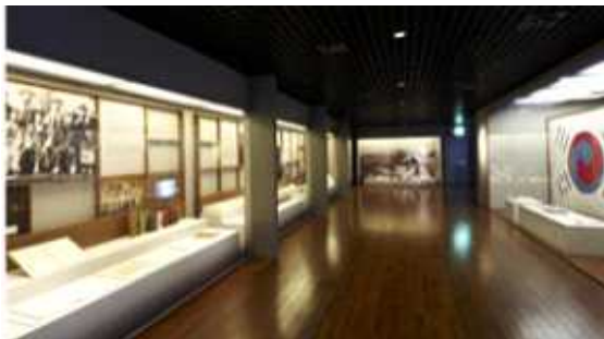
△ 상설전시실1 대한민국의 태동