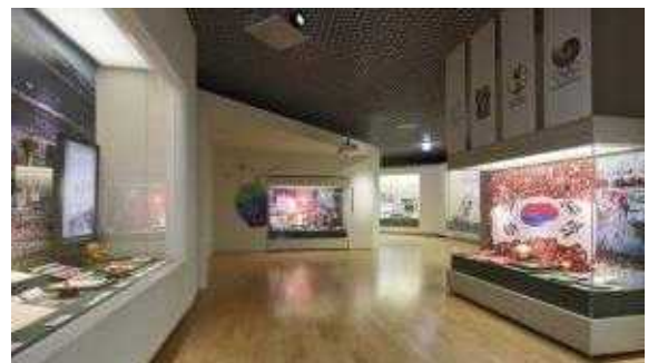
△ 상설전시실4 대한민국의 선진화, 세계로의 도약