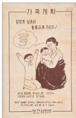
가족계획 포스터 (1966)