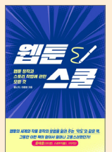
<웹툰스쿨> 저자 흥난지, 이종범

글만 잘 쓴다고, 그림만 잘 그린다고 웹툰 작가가 될 수 있는 것은 아닙니다. 웹툰 작가가 되기 위해서는 어떤 지식을 쌓아야 할까요? 작가가 되기 위해 필요한 기초작업에서부터 연재까지, 책을 통해 알아봅시다.