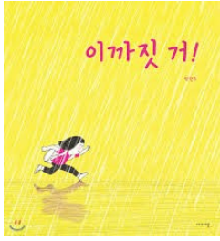
[이까짓 거!] 박현주/이야기꽃

이야기는 예외 없이 ‘문제 상황’을 다룹니다. 아무 문제없는 상황에서는 아무 사건도 생겨나지 않으니깐요. 또, 대개의 이야기는 보편적인 문제 상황을 다룹니다. 그래야 많은 사람들이 공감할 테니까요. 그럼에도 그 이야기들이 다 다른 까닭은 반응하고 대처하는 방식이 사람마다 다 다른 까닭이지요. 그러면, 이 그림책의 주인공 아이는 비 오는 날 우산 없는 이 문제 상황에 어떻게 반응하고 대처했을까요?