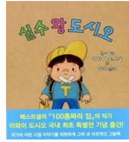
[실수왕 도시오] 이와이 도시오/북뱅크

자전적인 그림책입니다. 실수왕 아이들을 응원하는 작가는 책의 맨 뒤 ‘작가의 말’에서 ‘세상 모든 실수 왕들, 실패해도 괜찮아!’ 하고 한 번 더 말해 줍니다. 이 따뜻하고 정다운 작가의 말은 세상 모든 실수 왕들에게 커다란 위로가 될 것입니다*독후활동) 내가 실수했을 때, 나에게 해 줄 수 있는 응원의 말 쓰기