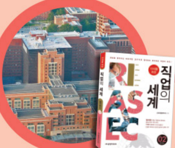
생명과학자 권준현 탐구형 편