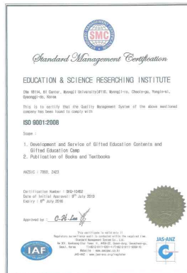
ISO 9001 국제캠프인증