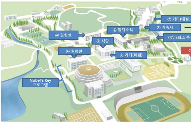
4동 기숙사 전경