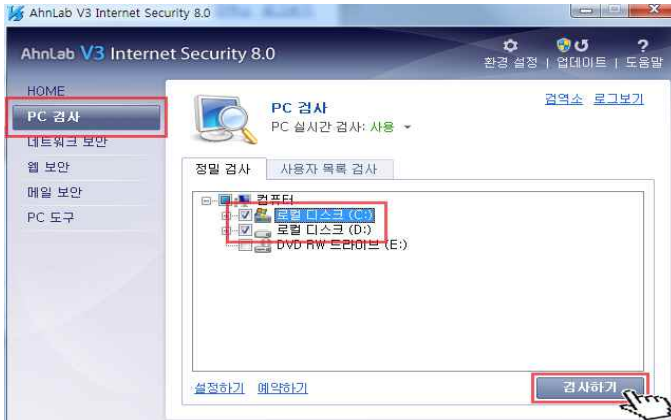
3. PC 검사 -> 로컬디스크 체크 -> 검사하기 클릭