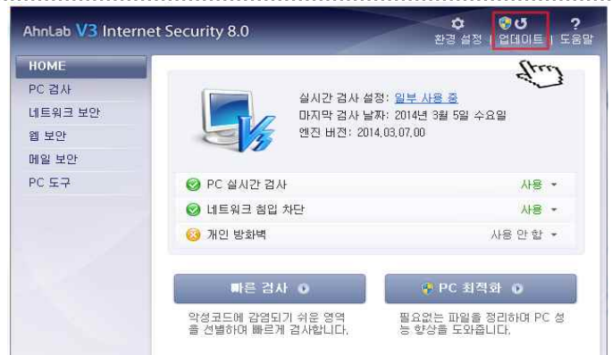
2. 백신 팝업창의 오른쪽 상단 업데이트 클릭(최신업데이트)