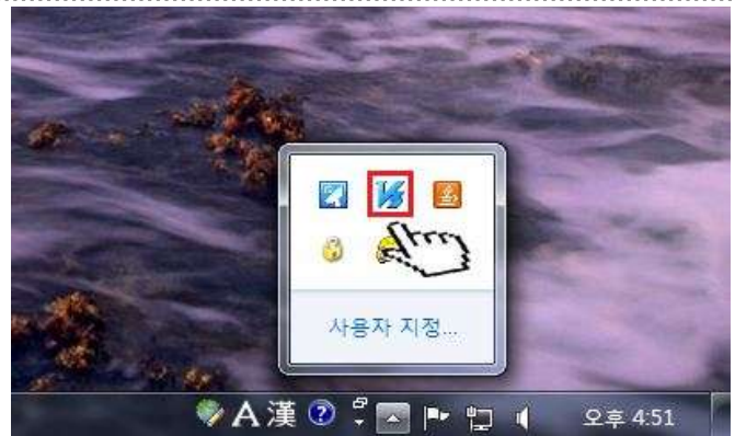
1. 윈도우 하단 작업표시줄의 V3 백신 Agent 더블 클릭