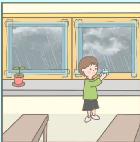
강풍에 대비하여 창틀과 유리사이에 빈틈이 없이 테이프를 붙입니다.