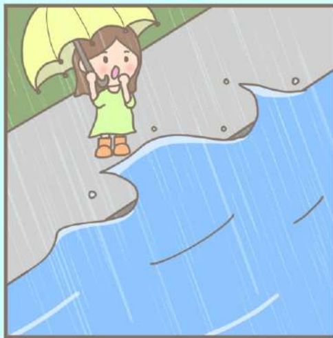
빗물이 넘칠 수 있는 하천, 배수로에 접근하지 않습니다.