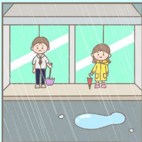
비가 많이 오면 건물 안과 같이 안전한 곳으로 대피합니다.