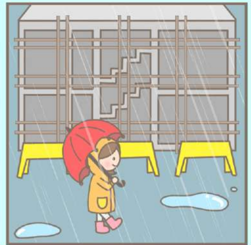
공사장, 경사지 등 붕괴우려지역에 접근하지 않습니다.