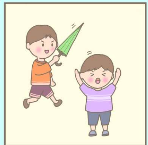
우산으로 위험한 장난을 하지 않습니다.