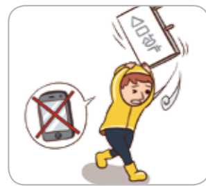
2 걸어가는 중에는 스마트폰 사용을 자제하고 주변을 경계