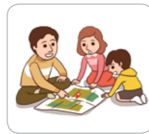
3 가족 간의 비상 시 연락방법과 대피장소를 미리 지정