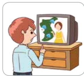
1 방송 매체를 통해 기상상황을 확인