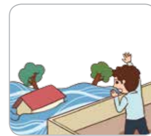
4 안전한 곳으로 대피하여 구조를 요청